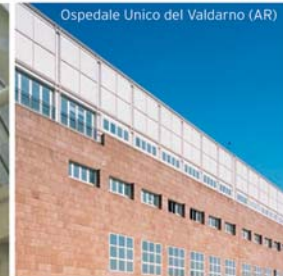
Ospedale Unico del Valdarno (AR)

cmb COOPERATIVA MURATORI E SBACCIANTI DI CARPI