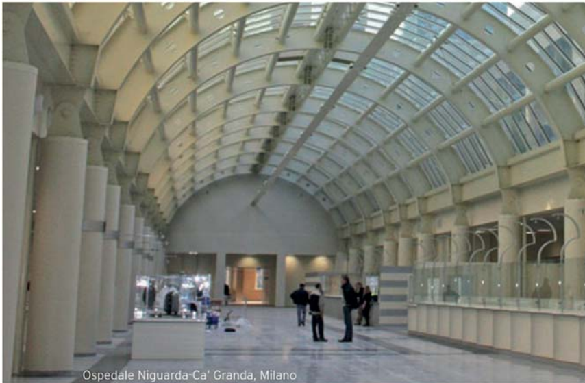
Ospedale Niguarda-Ca' Granda, Milano