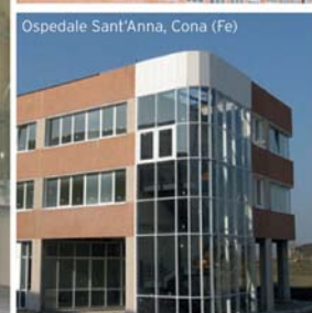
Ospedale Sant'Anna, Cona (Fe)

Progettare, realizzare e gestire grandi opere: qualità e responsabilità sono le fondamenta su cui CMB costruisce la propria solidità, da più di cento anni. E mentre gli scenari mondiali cambiano rapidamente, CMB guarda al futuro con la forza della sua gente, con la sicurezza che nasce dall'esperienza.